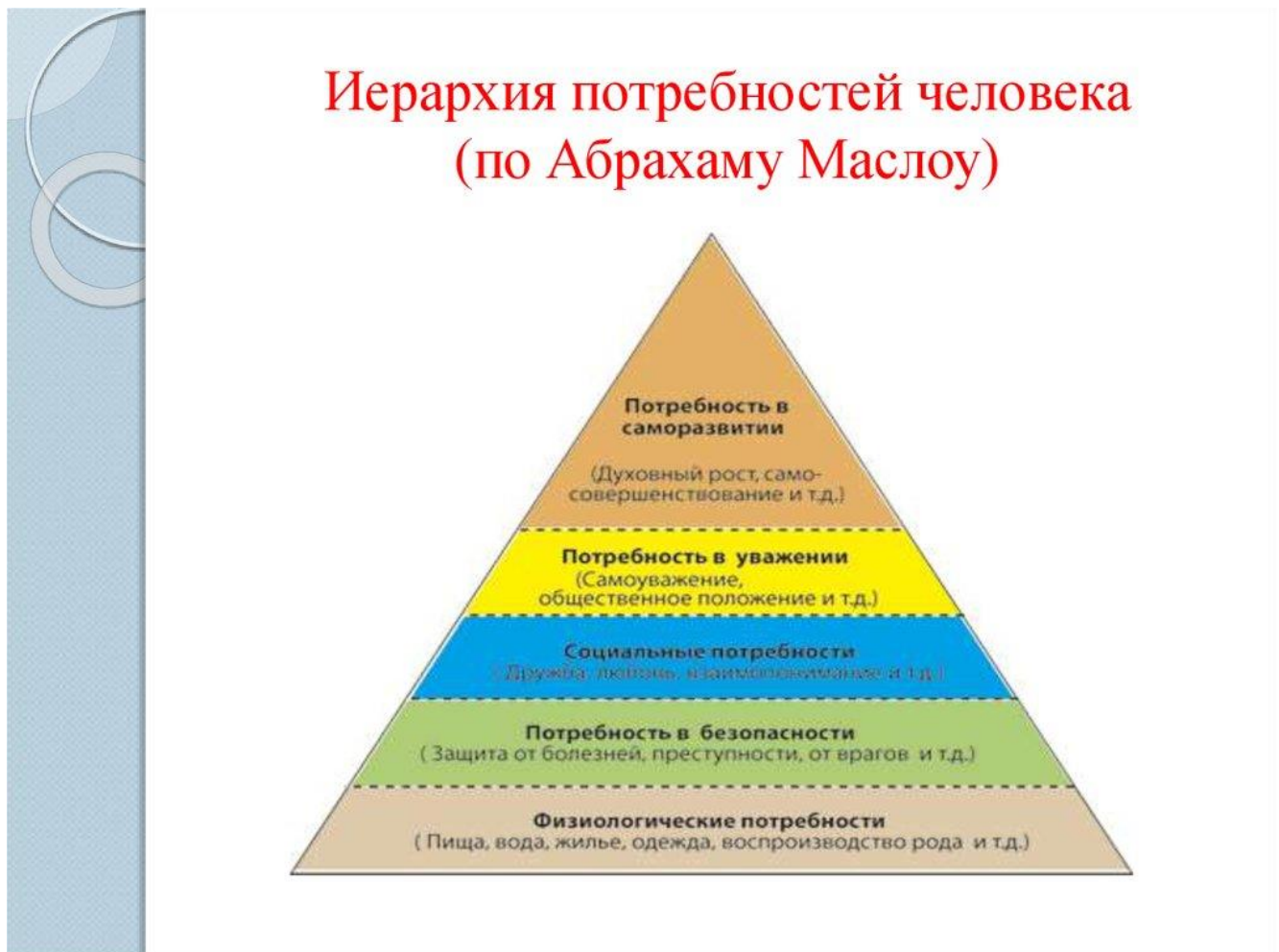
Рис. 2. Пирамида потребностей А. Маслоу

Все потребности можно классифицировать по группам. Групп потребности, по А. Маслоу, насчитывается пять, и они находятся в иерархическом расположении по отношению друг к другу: